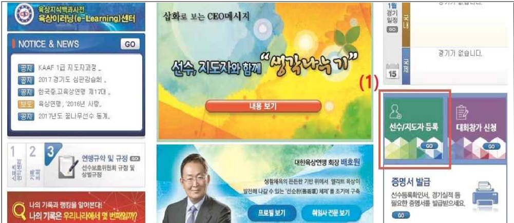
(1) 대한육상연맹 홈페이지 선수/지도자 등록 배너 클릭