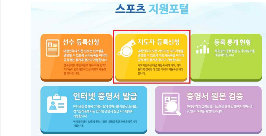
(2) 지도자 등록신청 클릭 후 육상종목 선택