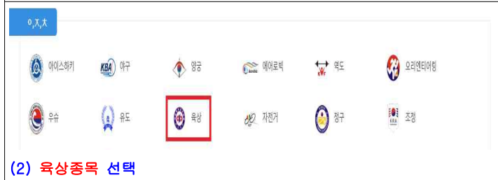
(2) 육상종목 선택