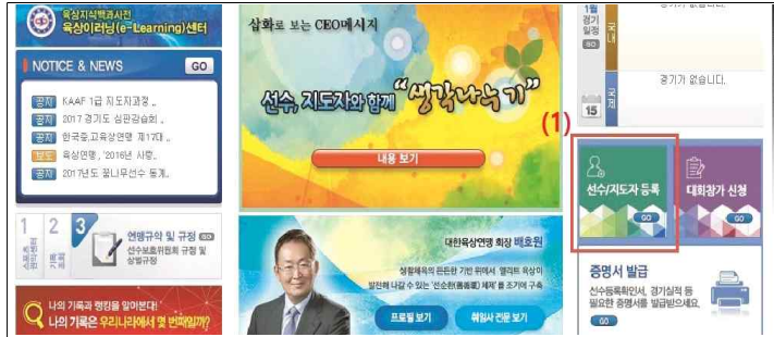
(1) 대한육상연맹 홈페이지 선수/지도자 등록 배너 클릭