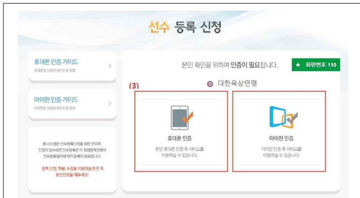
(3) 휴대폰인증 또는 아이핀인증으로 로그인 실시